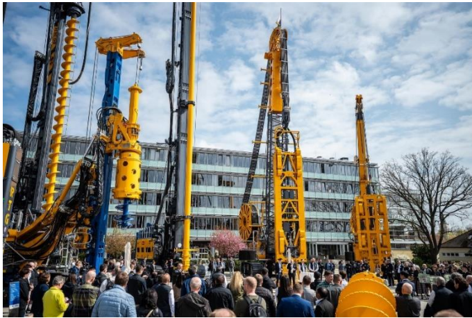
(2) Über 1.400 Gäste waren der Einladung der BAUER Maschinen Gruppe gefolgt.