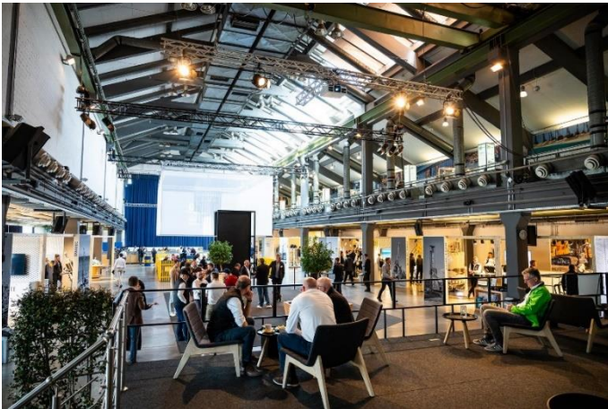
(5) Messeflair herrschte auch in der Alten Schweißerei.