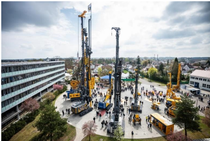
(3) Von Schlitzwand- über Ramm- bis hin zur Bohrtechnik: Bauer präsentierte eine breite Maschinenpalette.