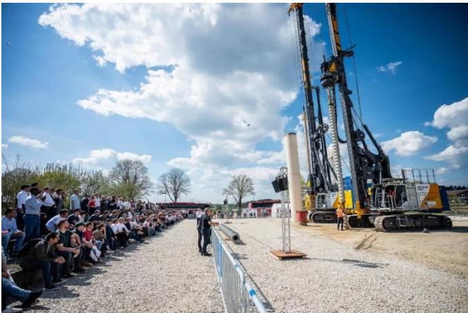
(6) Live-Demonstrationen im nahegelegenen Maschinenwerk in Aresing, Führungen und Expertenrunden standen ebenfalls auf dem Programm.