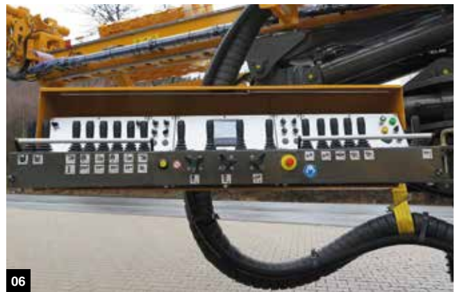
01 Maschinenüberwachung // machine monitoring 02 Manometerbox // manometer box 03 Funkfernsteuerung // radio remote control 04 Magazin MAG 6.1 // magazine MAG 6.1 05 optionale Komponenten // optional components 06 Elektrisches Steuerpult // electric control panel