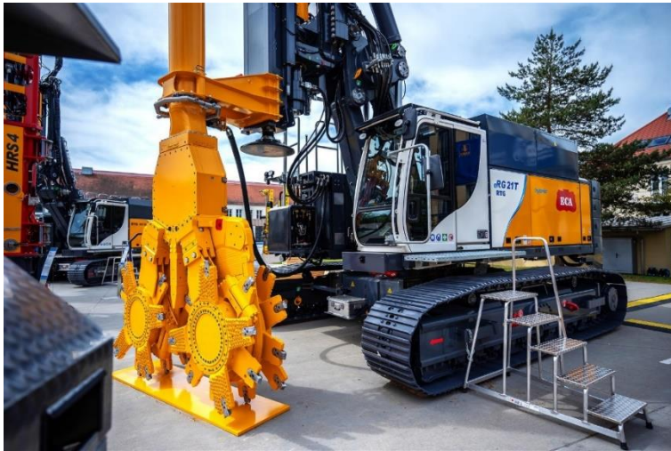
(3) Der Hybridbetrieb der eRG 21 T hybrid reduziert den Kraftstoffverbrauch und damit auch die CO 2 -Emissionen um bis zu 68 %